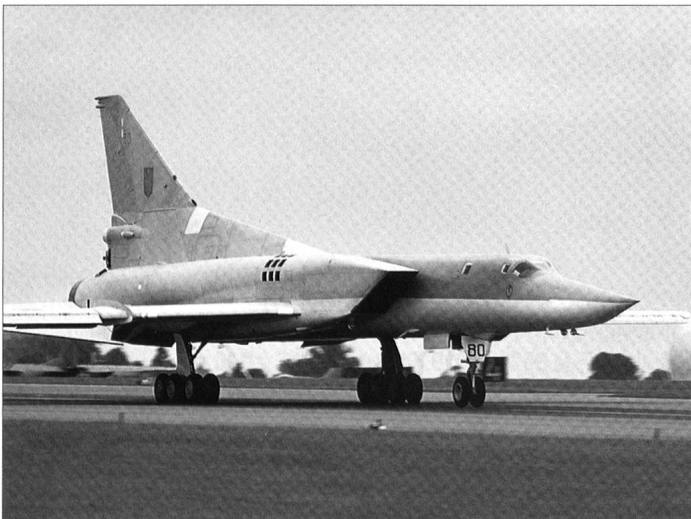
Les bombardiers stratégiques soviétiques, du Tu-90 Bear –intercepté par un CF-101 canadien et un F-106 américain respectivement, au Tu-22M Backfire et au Tu-26 Blackjack .