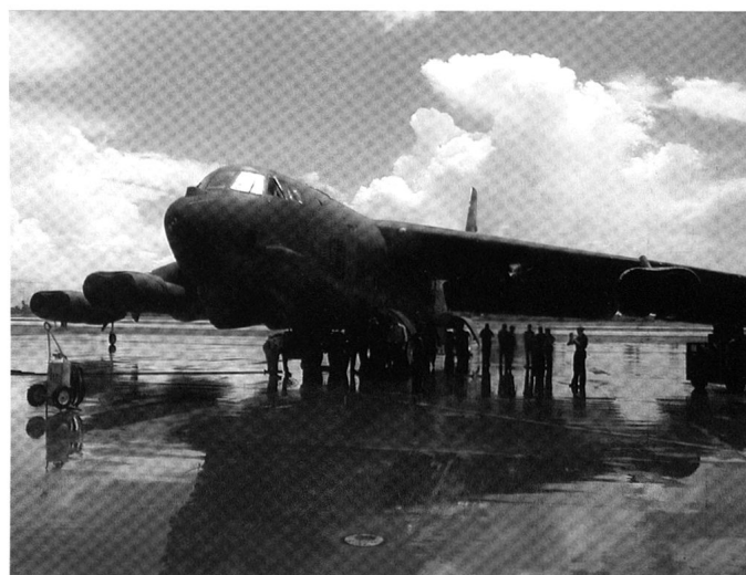
Les bombardiers stratégiques américains de la guerre froide, de haut en bas : le B47, le B52, le B-1B.