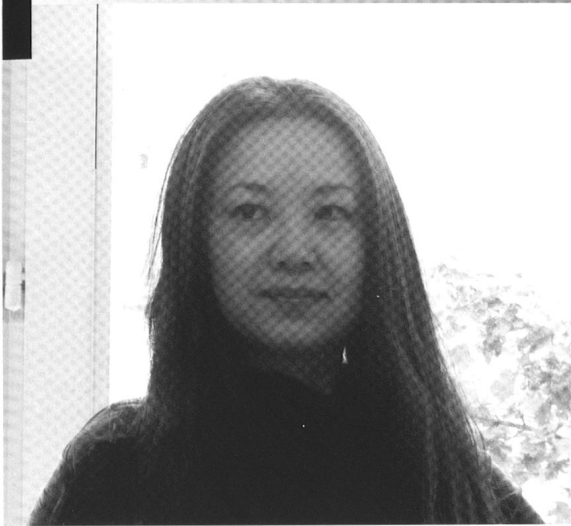
Shan Sa.