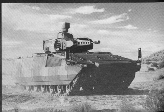
Le VCI du futur: le Puma .