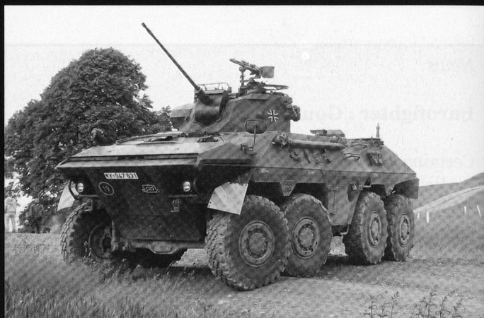
Le Luchs est armé d'un canon de 20 mm.