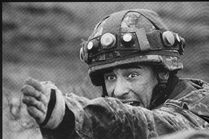
Grenadier de chars du Panzerbataillon 33 à Münster.