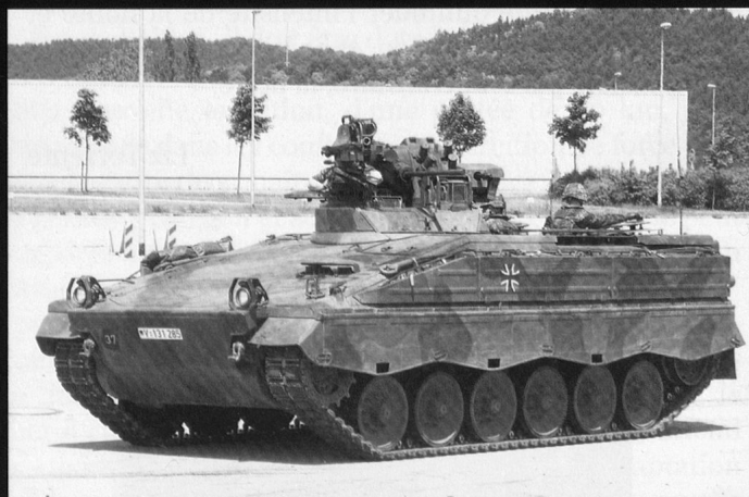
Le véhicule de combat d'infanterie Marder a été un modèle pour le développement des VCI de l'OTAN dans les années 1970-1980.