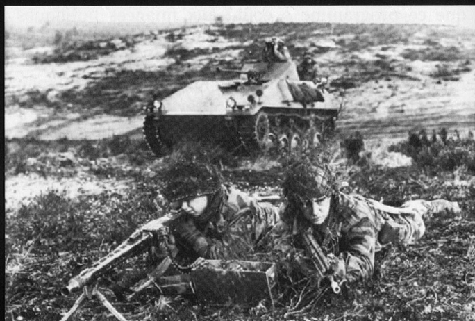
Les Panzergrenadiere d'après-Guerre ont disposé de véhicules transport de troupes HS-11 et HS-35.