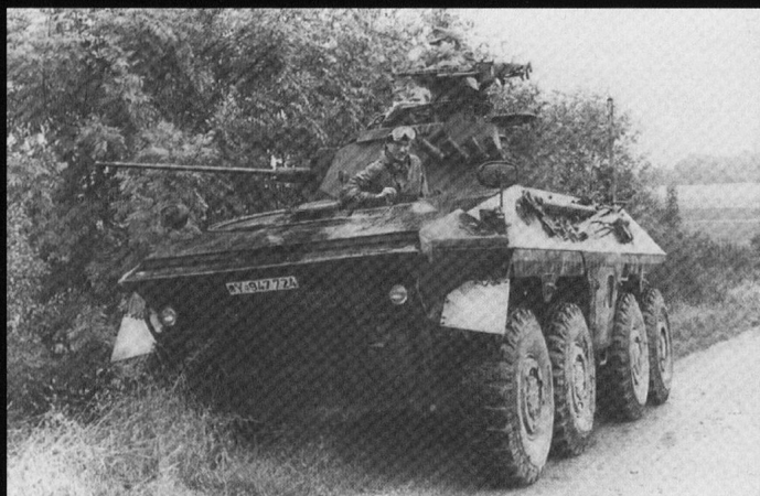
Le véhicule de reconnaissance Luchs , développé dans les années 1960 .