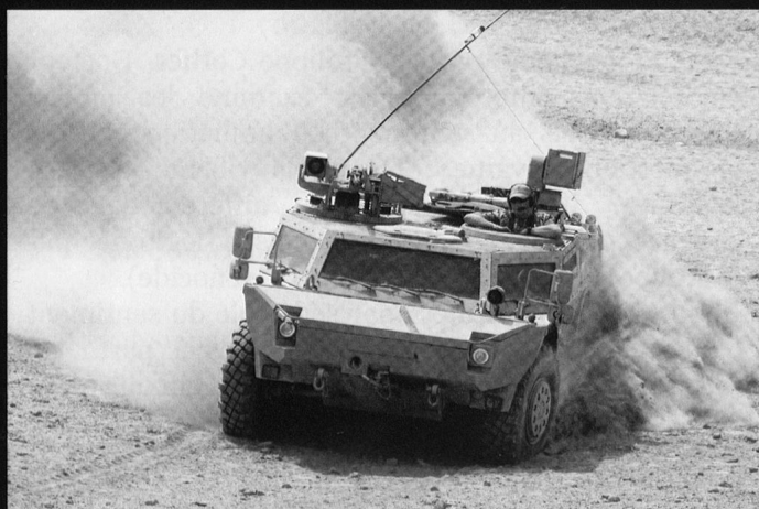
Le Fenek est moins lourdement armé, mais dispose de capteurs performants.