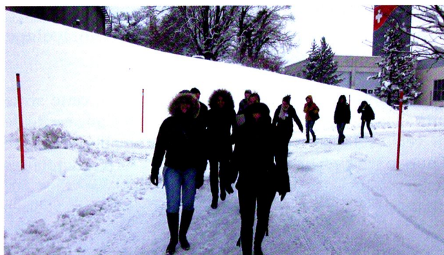
Team de projet, en route pour une visite des principaux bâtiments touchés par le projet.