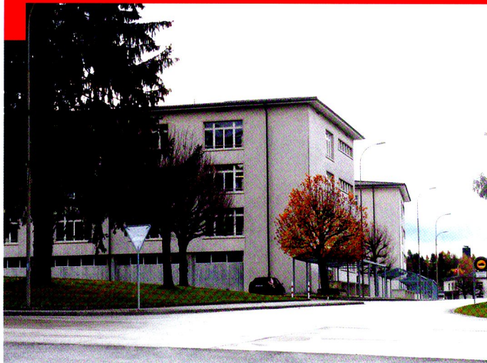
Toutes les photos © auteur.