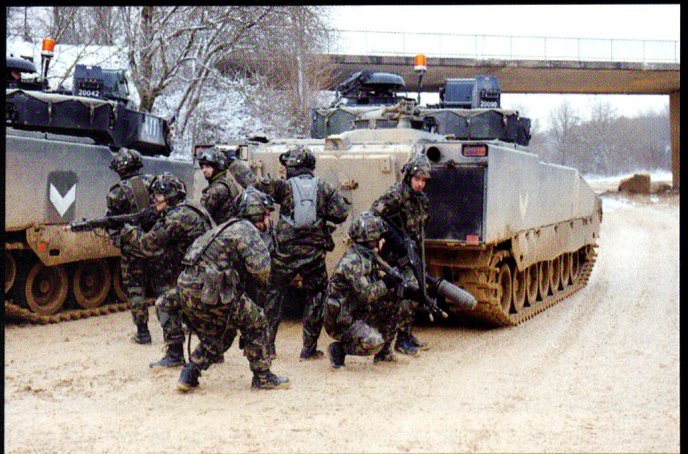
Ouverture de Combe la Casse avec une section de grenadiers de chars débarquée.