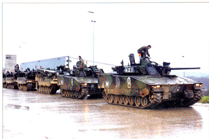
La cp gren chars 17/4 (+) prête pour débiter les exercices de compagnie de la 2 e semaine.