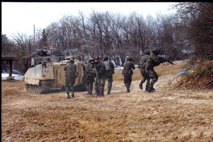
Débarquement des grenadiers de chars à Combe la Casse.