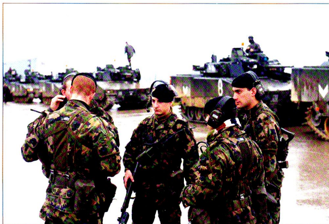
Derniers préparatifs entre le chef de section, le chef de la formation débarquée (CAF) et les sous-officiers.

Chaque grenadier de char de combat reçoit à son entrée en service un équipement personnel spécialement formaté à son nom, avec une carte individuelle. Il s'agit d'une tenue appelée PAB que l'on met par-dessus son harnais. De plus, il touche un fusil d'assaut déjà formaté SIM (simulation). Les chars, sont également équipés de simulateur de tir performants, ainsi que de réflecteurs avertissant le commandant de véhicule s'il est touché ou en mesure de continuer le combat. Plusieurs possibilités existent pour le char : totalement (« total kill ») ou partiellement détruit. (« mobility kill »). Dans le premier cas, il faut désormais tenir compte du fait que les grenadiers de combat embarqués dans le véhicule peuvent alors être touchés, même à l'intérieur du char !