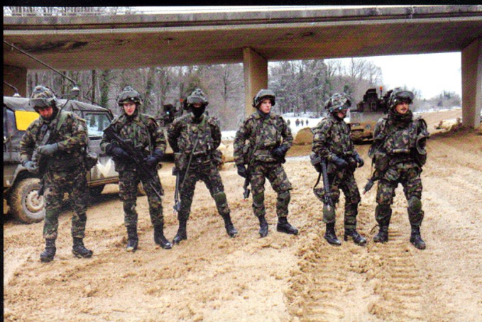
Préparation pour la critique d'exercice.