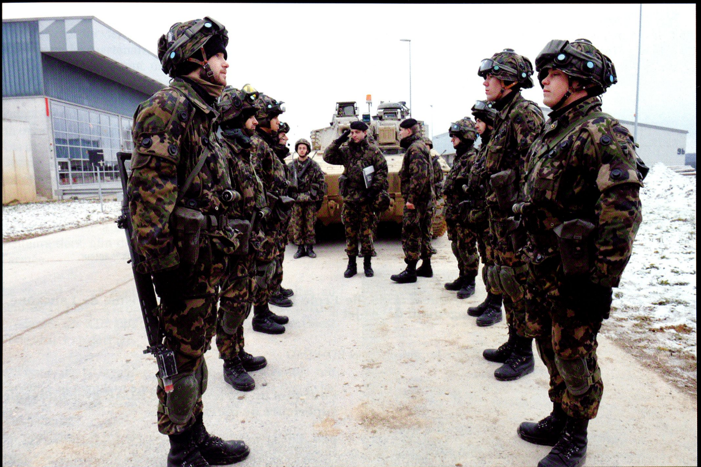
ZOUAVE : Annonce de la 17/4 au commandant de bataillon, avant le départ pour l'exercice.