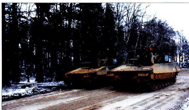
L'exercice commence : le CV90 dispose du même rapport poussée/poids que le Léopard ; au combat, les deux se complètent efficacement.

Par rapport aux anciens systèmes de simulation ( Solartron 74 ou Sim Leo Talissi 81 ), il faut noter que le type de munition implique également des effets différents. Un impact d'obus flèche ou un coup de 12,7 mm n'ont en