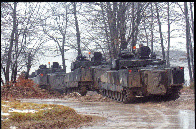
Une section de CV90 se prépare à quitter son secteur d'attente pour un nouvel exercice.