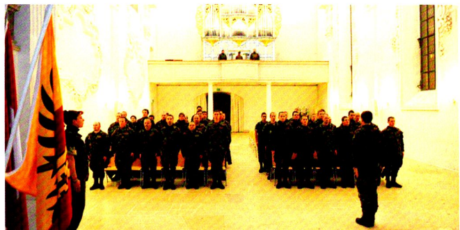
Exercice ZBYE : visite de corps, 16.12.2010 à Porrentruy. Il y a même un organiste au bat chars 17 !