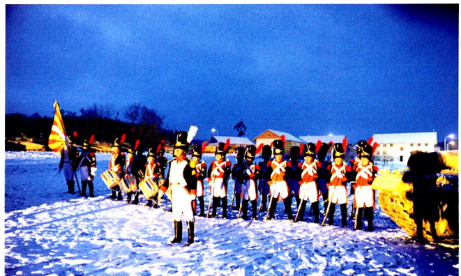
Les Vieux Grenadiers de Genève tirent une salve d'honneur pour le bataillon, une salve pour la brigade. Leurs tambours entonnent la marche au drapeau...