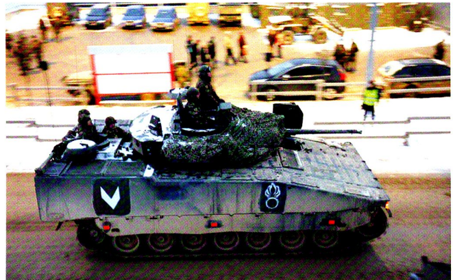
Une centaine de visiteurs sont venus jusqu'à Nalé, bravant un froid polaire, pour voir un exercice de bataillon, le défilé et la cérémonie de remise de l'étendard.