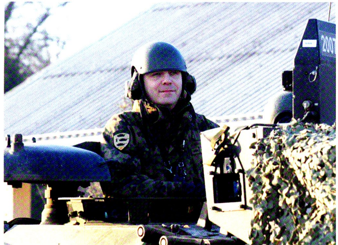
Lors de l'exercice de bataillon, le commandant est sur la passerelle.