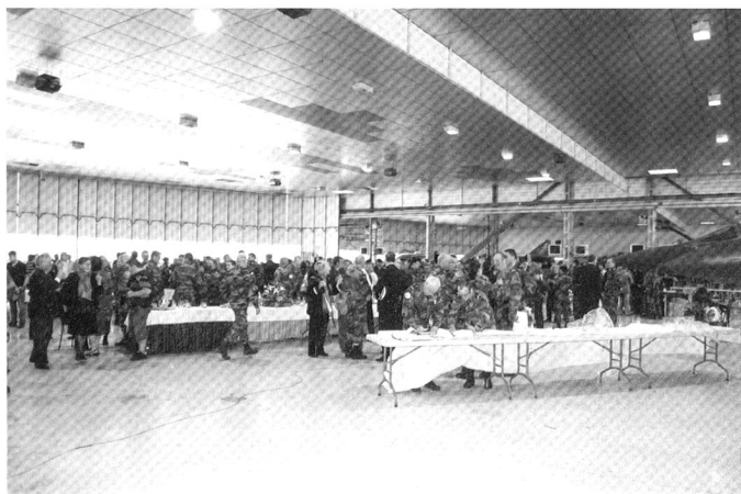
La cérémonie de remise des prix.