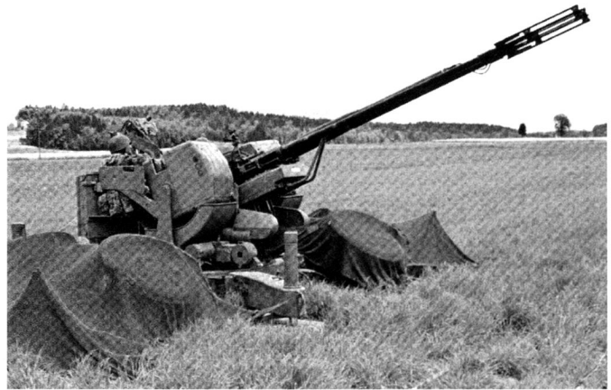
Canon DCA 35mm 63 Oerlikon, le premier canon radarisé du pays, encore en service à l'heure actuelle.

L'introduction du Bloodhound et des 35 mm induit un saut qualitatif au sein de la DCA. Jusqu'à l'introduction du Rapier , elle ne connaîtra pas de nouvelles armes mais subira de nombreuses améliorations, comme la mise à niveau des appareils de conduite de tir de la DCA moyenne (35 mm) avec le remplacement, de 1976 à 1983, des radars « chauve-souris » par le « Skyguard » 15 ou