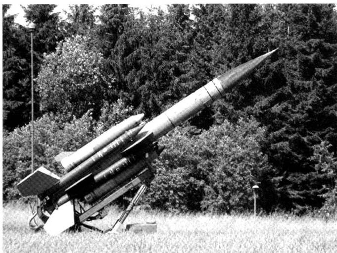
Engin à longue portée Bloodhound .