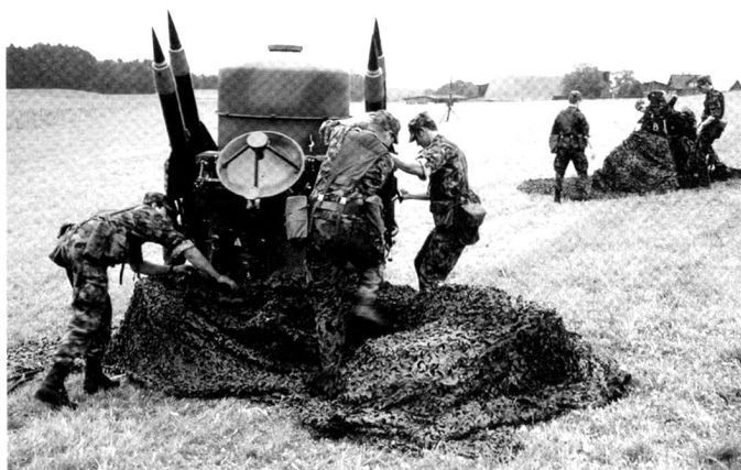
le Rapier a été introduit en 1984, peu après son succès dans la guerre des Malouines; il est toujours en service aujourd'hui.