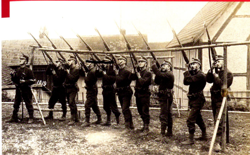
La DCA suisse à ses débuts, un engagement quelque peu approximatif!