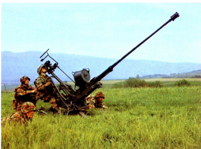
Le nouveau venu : canon DCA 20mm 54 Oerlikon, qui servira jusque sous l'A 95.

largages de bombes. De plus elle est engageable de jour comme de nuit, au contraire de l'aviation. Nonobstant cet état de fait, la DCA restera, durant tout le Second conflit mondial, le parent pauvre du service nouvellement créé.