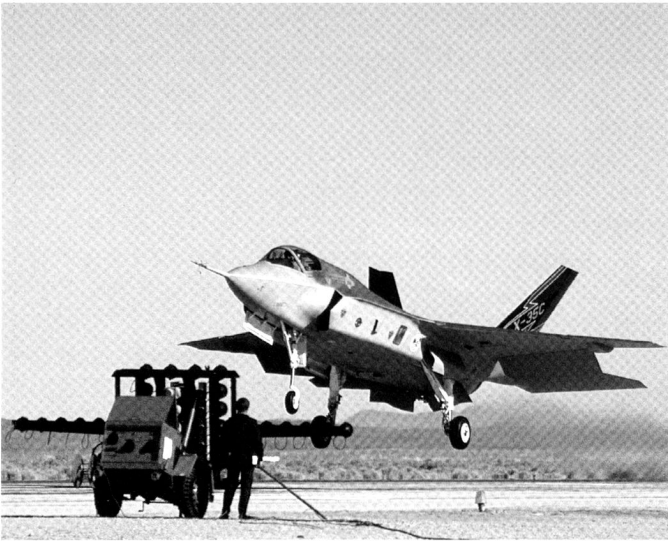
Le F-35C est la version aéronavale, destinée à l'US Navy.