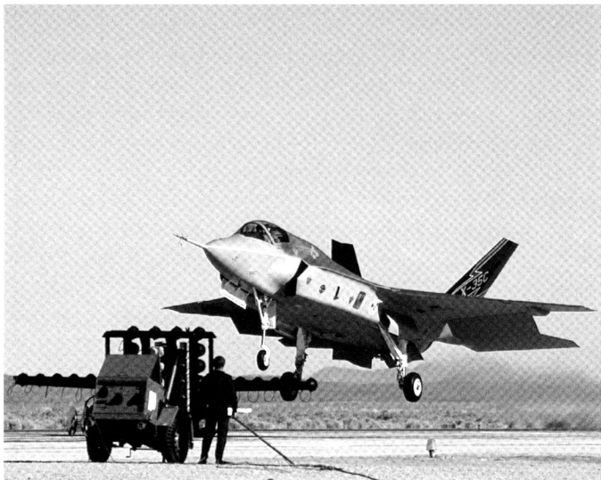
Le F-35C est la version aéronavale, destinée à l'US Navy.