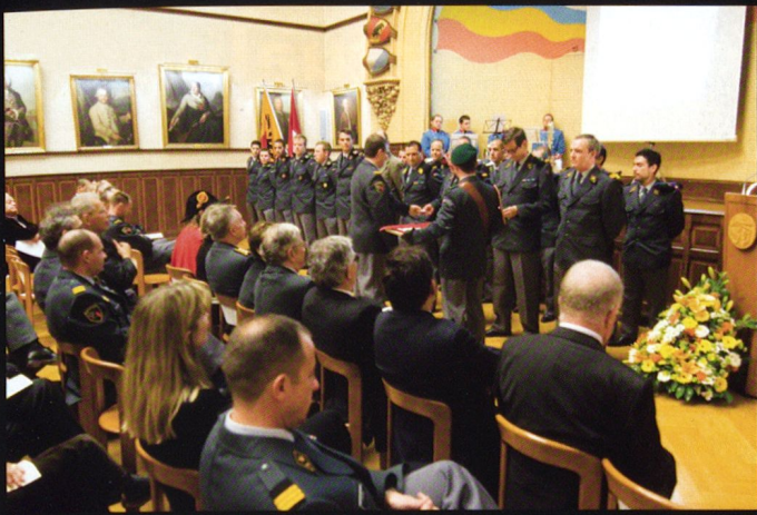
Ci-dessus: l'assemblée générale, organisée chaque année dans la salle des rois de la société de l'Arquebuse. Remise des insignes aux nouveaux membres.