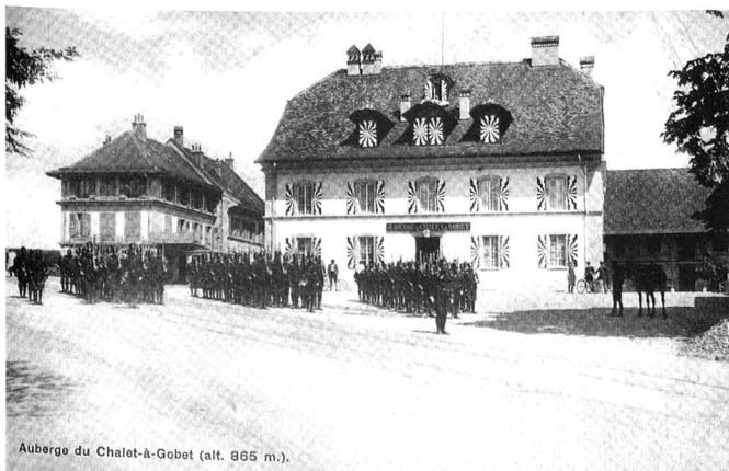
Auberge du Chalet-à-Gobet (alt. 865 m.).