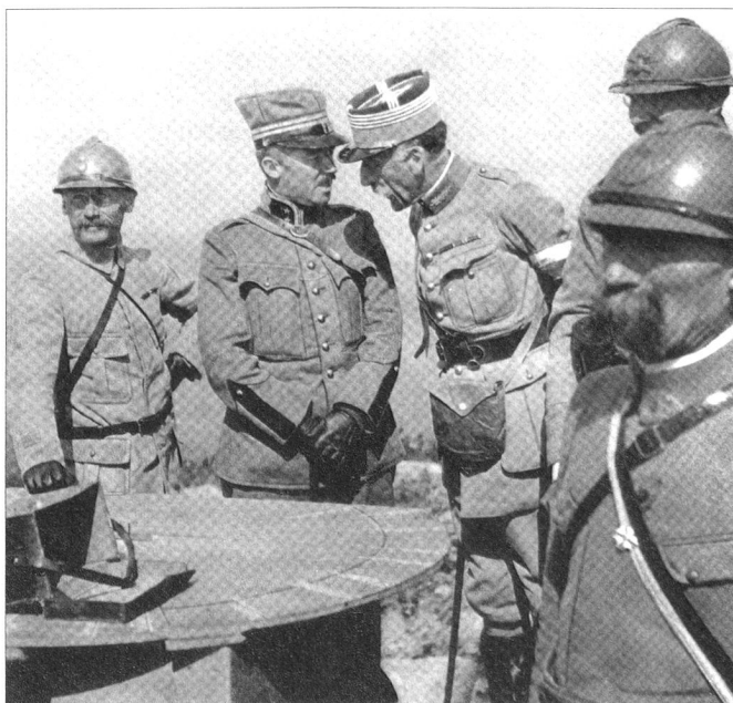
Visite de Guisan sur le front de Verdun en 1916.