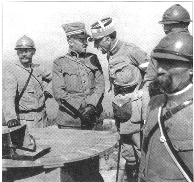
Visite de Guisan sur le front de Verdun en 1916.