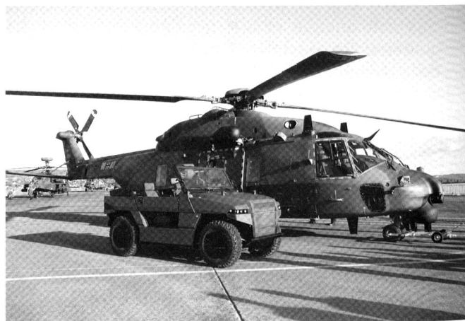
L'hélicoptère de transport NH90 est capable d'emporter des véhicules légers tous terrains.

http://www.opex360.com/2010/05/25/lallemagne-suspend-lachat-dhelicopteres-tigre/ (26.04.2010)