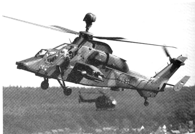
La version UHT du Tigre (PAH-1) destiné à la Bundeswehr. Il existe deux versions destinées à la France, ainsi qu'une version export du Tigre .