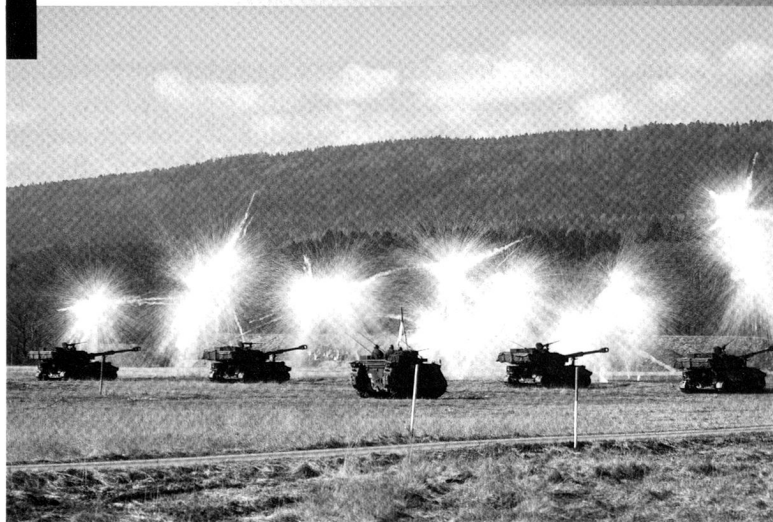
Tir de nébulogènes par une batterie d'artillerie, avant de s'éclipser.