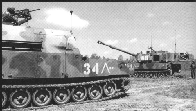
Le M109 est aujourd'hui soutenu par le M992 FAASV