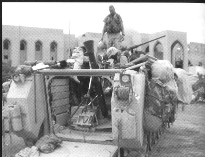
Mise en batterie d'un mortier de 120 mm en Irak. Le lance-mines est une arme essentielle dans le combat en zones urbaines (CEZU), en raison de sa grande élévation