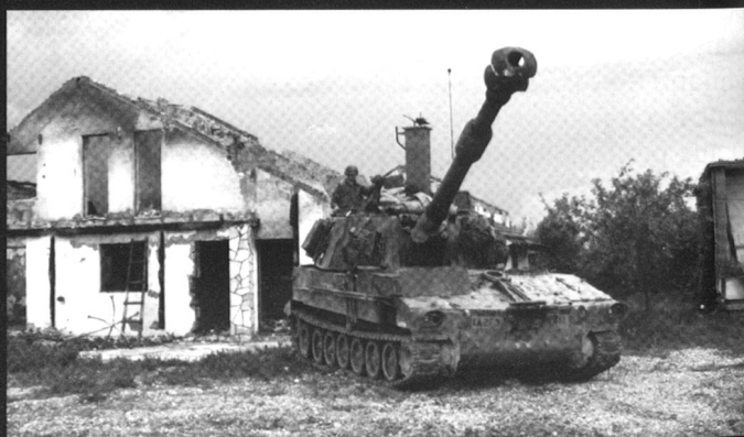
M109 de la 1 st Armored Division en Bosnie Herzégovine