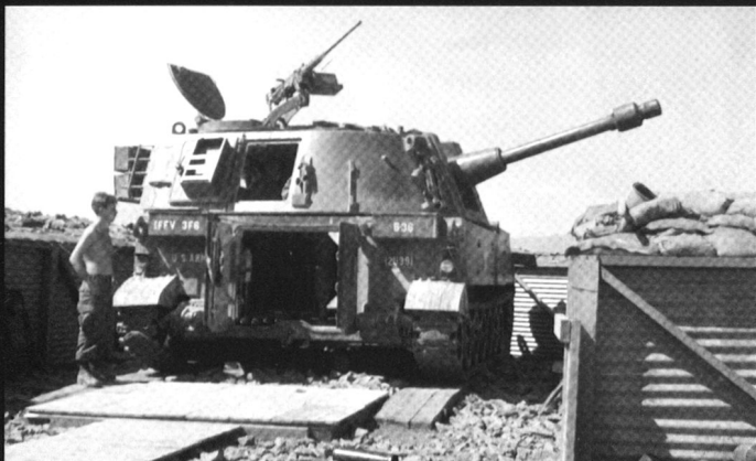
Le M108 d'origine emportait un obusier de 105 mm