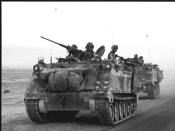
Plusieurs versions du M113 sont utilisées pour emporter des mortiers de 81, 106 et 120 mm: M106, M120 et M125.