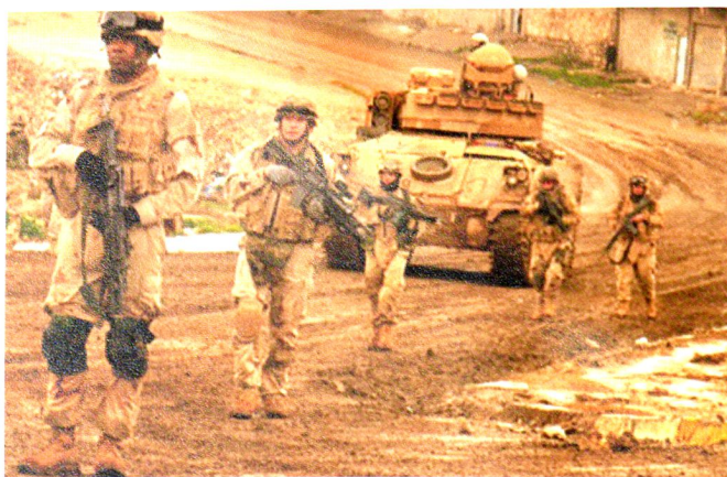
Patrouille d'un Bradley (M3A2) du 3 ACR dans les rues de Bagdad, durant le déploiement OIF3, 2004.