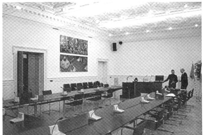
La Salle de la Commission de défense nationale (CDN).