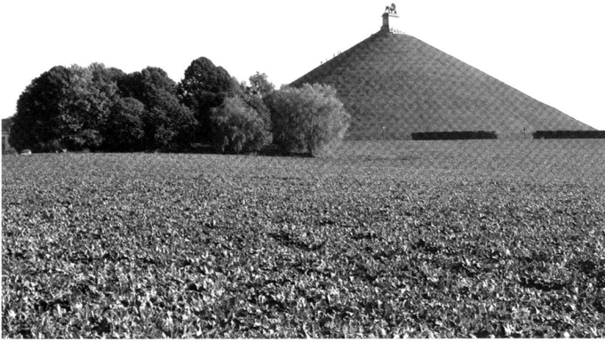
La Butte du lion, mémorial de la bataille de Waterloo (18.06.1815).