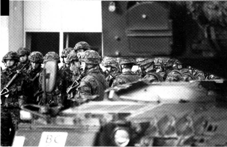
La formation de base et technique des troupes blindées a lieu sur la place d'armes de Thoun BE.