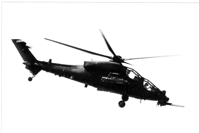
L'hélicoptère de combat Agusta A-129 Mangusta .

un très bon véhicule. 7 Il est d'ailleurs patent que d'autres pays l'ont acheté après l'avoir vu en action sur le terrain. Evidemment, ce n'est pas un véhicule invulnérable, parce qu'avec une telle charge d'explosif même un char d'assaut n'aurait pas pu s'en sortir indemne. De plus, le soldat italien possède une caractéristique tirée de notre culture et du fait que nous sommes un peuple de migrants : n'importe où dans le monde, nous cherchons à nous intégrer avec la population locale. Nous n'avons donc aucun problème à dialoguer avec tout le monde, parce que nous sommes naturellement doués pour cette activité interlocutoire et médiatoire. En ce qui concerne la reconstruction, nous sommes en train de bien travailler (...). Nous pourrions même faire mieux avec plus de ressources financières. Quand nous n'avons pas une capacité technique spécifique, nous nous adressons à la Réserve Sélectionnée, 8 qui est en train de donner des résultats positifs. Nous recrutons parmi la population civile surtout des ingénieurs, des architectes, des médecins, des avocats, parce que ce sont eux qui peuvent nous aider au mieux dans l'activité de reconstruction. Après quoi, nous nous adressons à la main d'œuvre des compagnies locales pour obtenir des solutions rapides et efficaces.