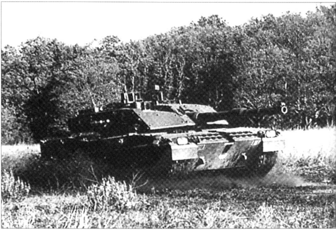
Le char de combat Ariete , similaire au Léopard 1 allemand, dont il reprend certains éléments.