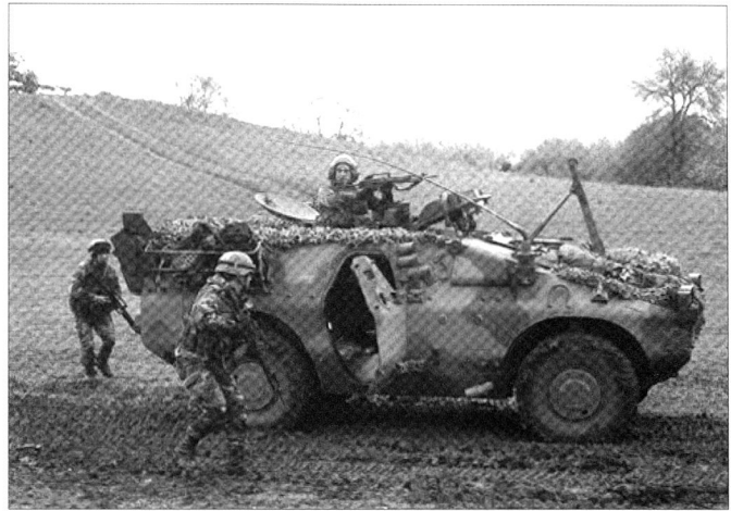
L'armée italienne entretient de nombreuses troupes légères, à l'instar du bataillon Lancieri di Aosta .