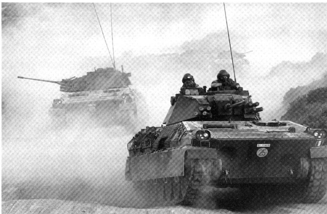
Ci-dessus : char de grenadiers Dardo . L'armée italienne vient d'acquérir 22 lance-fusées MLRS et 70 Panzerhaubitze 2000.

Après ce qui s'est récemment passé à Kaboul, quels efforts peut-on faire en matière de défense conventionnelle ? Peut-on continuer à combattre par le biais de vieux schémas les kamikazes, les voitures piégées et la guérilla urbaine ?