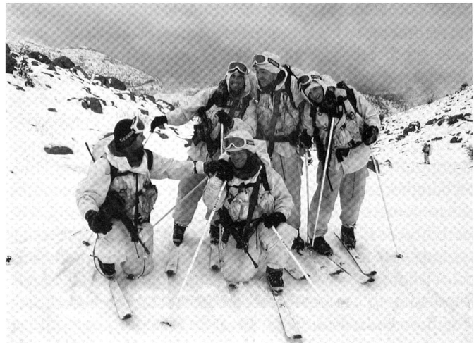
Plusieurs formations de montagne sont également maintenues en Italie.