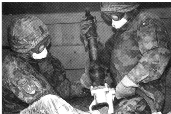
Troupes de sauvetage travaillant dans les décombres.