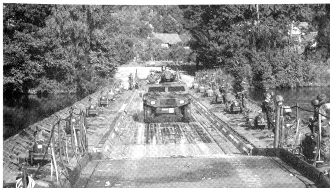
Pont flottant à Widegg.