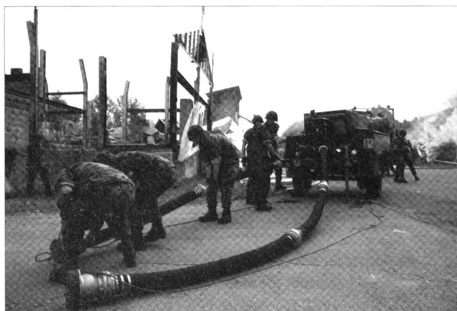
Les troupes de sauvetage peuvent également être engagées dans les cas d'incendies importants.