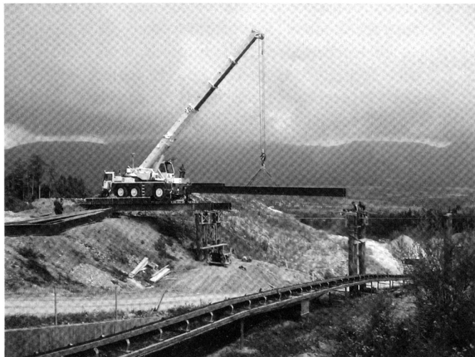
Construction d'un PPA à Arch.