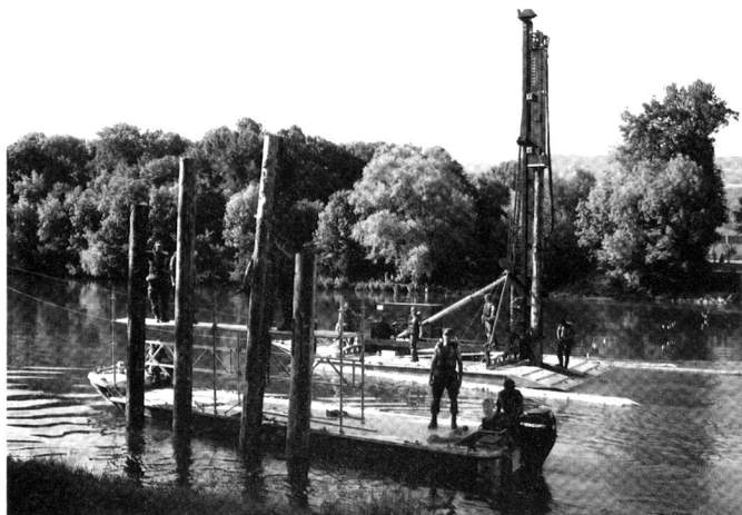
Mise ne place de sonnettes pour le PPA.