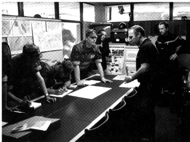
Cadres des troupes de sauvetage durant un rapport de coordination.