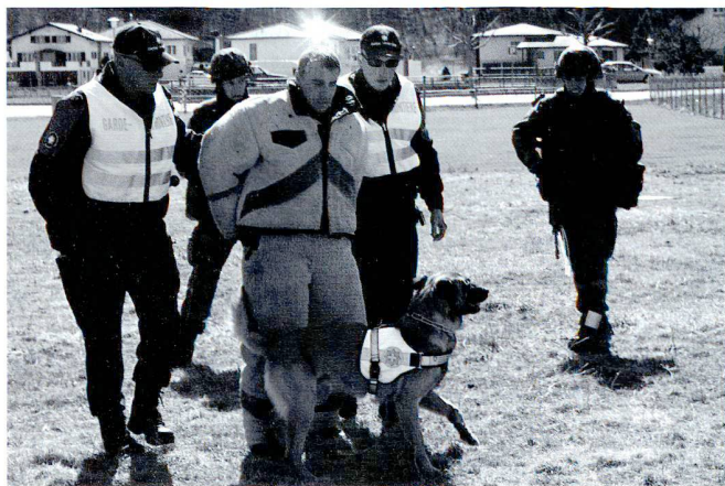
CC/CR 2009, entraînement en formation HYLLLOS : coopération avec le Corps des gardes-frontières (Cgfr) à Tourtemagne.