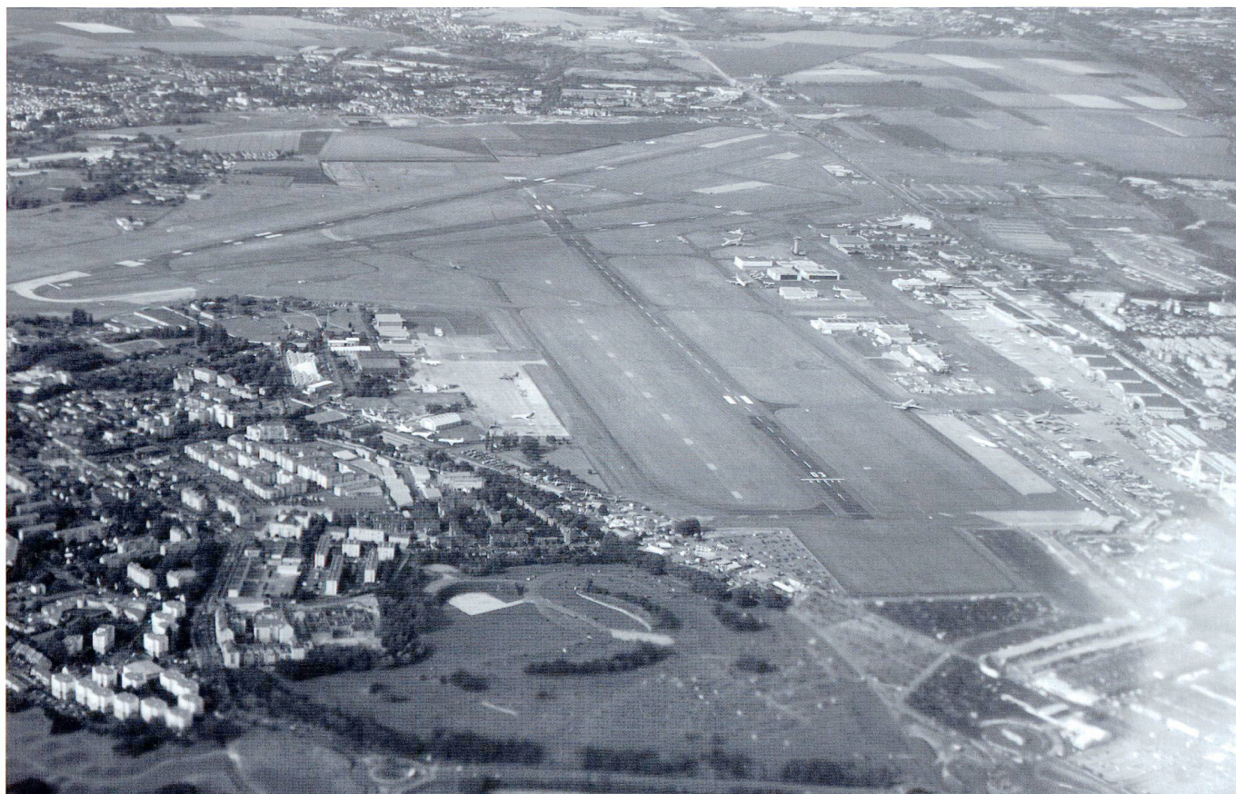
Le Salon de l'aéronautique et de l'espace vu du ciel.