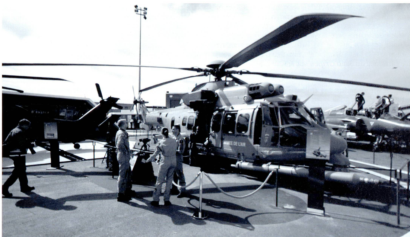
Le Cougar , renforcé et armé, est utilisé par les forces spéciales françaises pour la récupération des pilotes ou les coups de main.