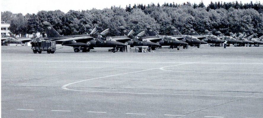
Visite de la base aérienne (BA705) de Tours, en mai 2009.