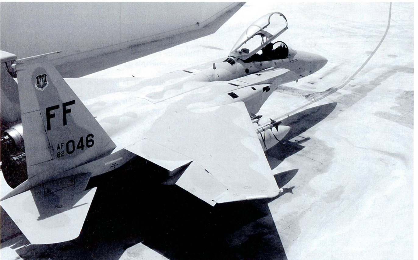
Le F-16 et le F-15 Eagle (photo) sont aujourd'hui l'épine dorsale de l'USAF.