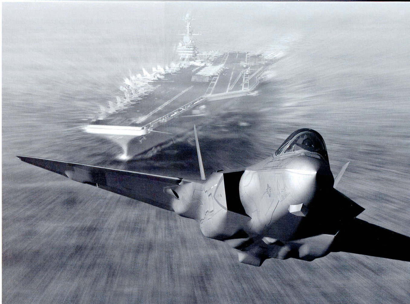
La relève des appareils de l'US Army et de la Navy repose entièrement sur le F-35 Lightning II .