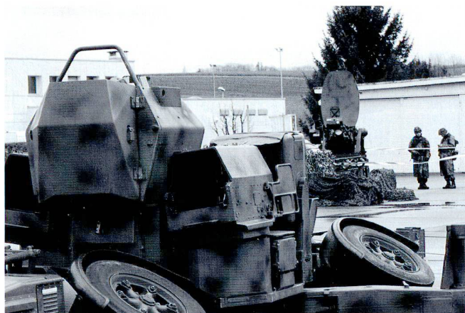
La défense sol-air nécessite une combinaison de canons, de missiles et de radars.

En réseau et en combinaison avec les aéronefs, afin de constituer une véritable architecture de Défense Sol-Air! Il est trop tôt pour parler d'un armement précis, mais notre rapport décrira des capacités devant répondre à des menaces d'un spectre large ; on peut déjà en déduire que les systèmes DSA du futur seront certainement évolutifs. Et pour le reste, il faut attendre les réponses de l'EM de l'Armée.