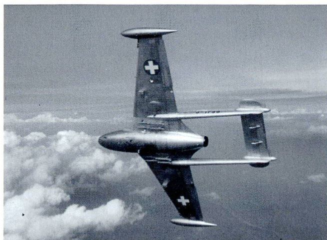
Le De Havilland Venom est le successeur du Vampire , acquis en 1946.

Aucun projet de chasseur à réaction développé en Suisse n'a abouti et l'industrie aéronautique nationale n'a pu survivre qu'en produisant sous licence des appareils conçus ailleurs. Parmi ces projets malheureux, le P-16 est celui qui a été le plus loin. Le 25 avril 1955, le prototype, immatriculé J-3001, effectue son premier vol. Un événement qui fait la une de la presse nationale. Quatre mois plus tard, ce même avion tombe dans le lac de Constance suite à une panne de moteur. Un second prototype (J-3002) est testé en 1956 et le Conseil fédéral entre en matière pour l'achat de 100 unités. Mais lorsque le troisième P-16 (J-3003) s'écrase lui aussi sur le lac de