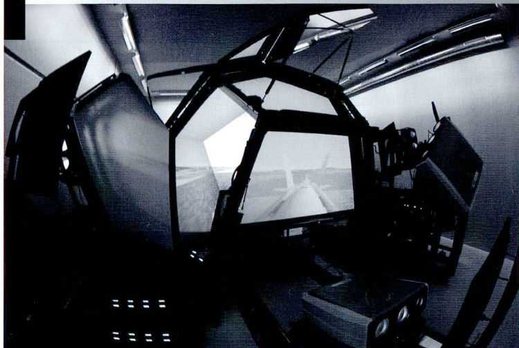
Le simulateur permet d'exercer le ravitaillement en vol en toute sécurité.