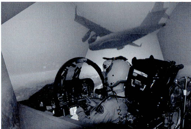
Le simulateur SHOTS et son écran donnent au pilote une vision réaliste et en temps réel.