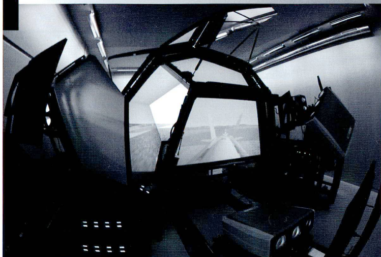
Le simulateur permet d'exercer le ravitaillement en vol en toute sécurité.