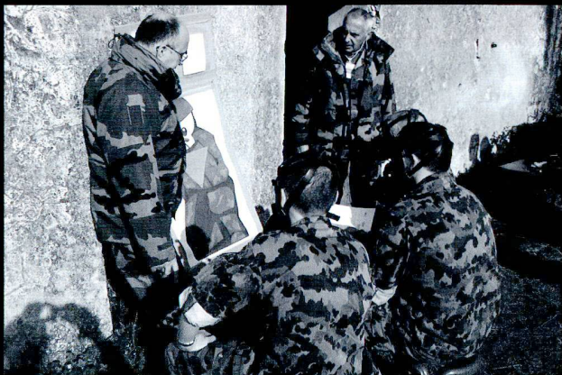
Donnée d'ordres pour les tirs en conditions C. Toutes les photos © Auteur.