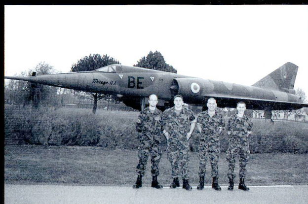
La délégation suisse devant un Mirage IV sur la Base Aérienne d'Orange