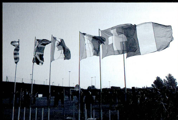
Fierté de voir notre drapeau dans le ciel lors de la cérémonie finale