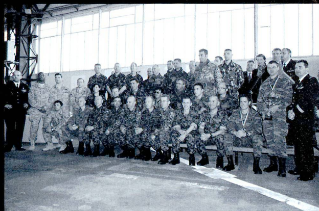
Participation internationale, à côté de l'USAF, RAF et des Belges, on trouve des équipes d'Italie et du Canada