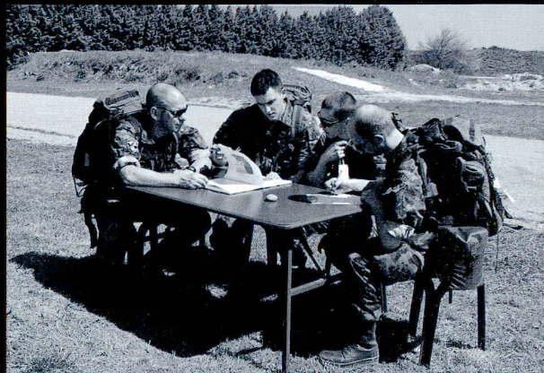
A côté des épreuves physiques, le programme comprenait aussi des tests exigeants