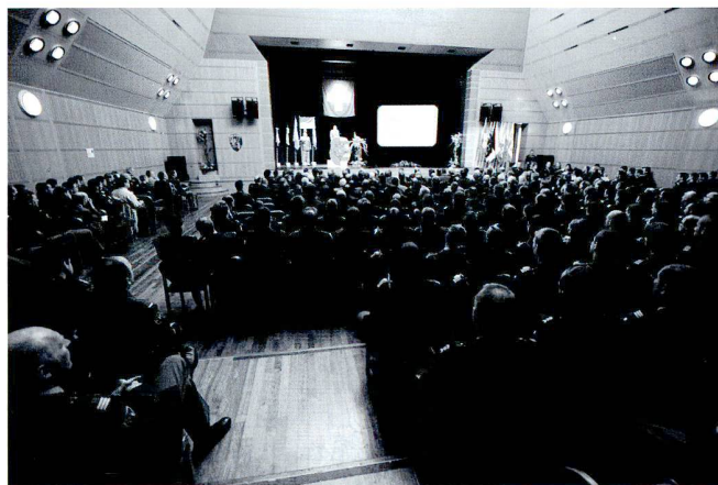
Rapport de la rég ter 1, Estavayer-le-lac.