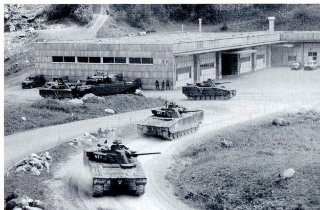
Exercice de section sur la place de Wichlen.

à partir de positions préparées, il s'agit de le fixer sur place, en l'empêchant de rejoindre ses forces principales et en le privant de l'appui de celles-ci ; cela se fait généralement par le feu – au besoin avec un appui immédiat par le feu des lance-mines ou de l'artillerie-, à la plus grande distance de combat possible (1'500 à 3'500 mètres).