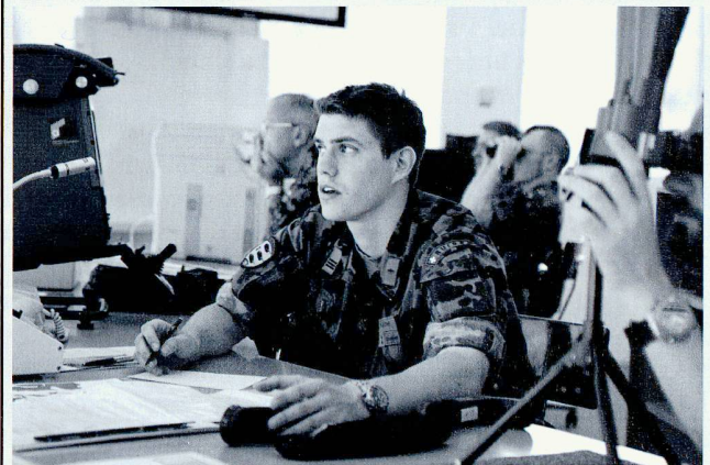
Inspection de la cp gren chars 17/4 par le commandant de brigade.

ou sur les flancs. Elle crée ainsi les conditions favorables pour la poursuite de l'action au niveau du bataillon. Une fois l'action menée à bien, la compagnie se réorganise afin de se tenir prête à des actions ultérieures.