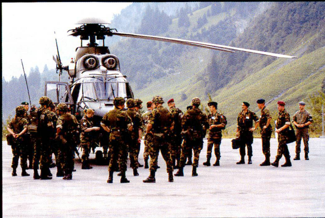
Accueil du Team d'inspecteurs OSCE, arrivés à Wichlen en Cougar .