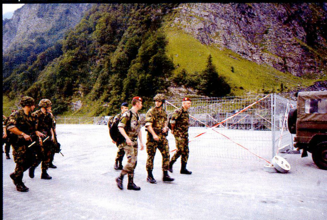
Déplacement vers les places d'exercice, sous bonne escorte