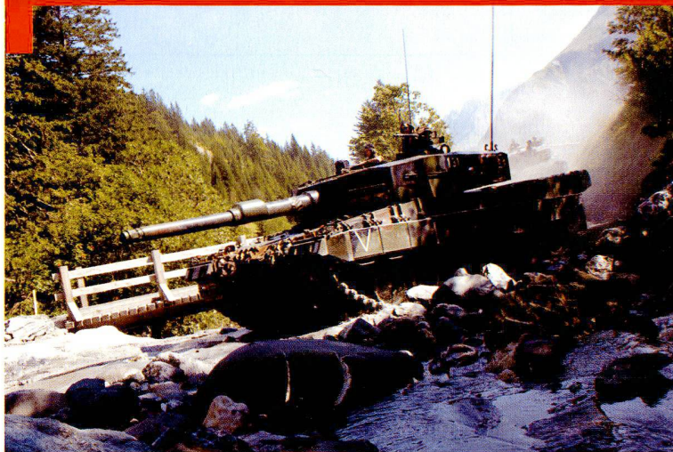
Cp chars 17/1