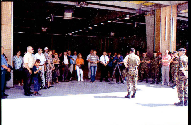
Une démonstration de tir a été organisée le 25.08 pour les partenaires et anciens du bat chars 17.

Alors qu'un « team » (17/1 et 17/4) s'entraînait à Wichlen, un second « team » composé des compagnies de chars 17/2 et 17/3 était engagé sur la place de tir de Hinterrhein. Les résultats des tirs ont été centralisés dans l'EAVC.