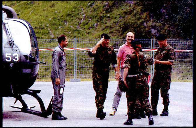
Accueil du commandant de brigade et de ses invités, arrivés en EC635, par le S1.