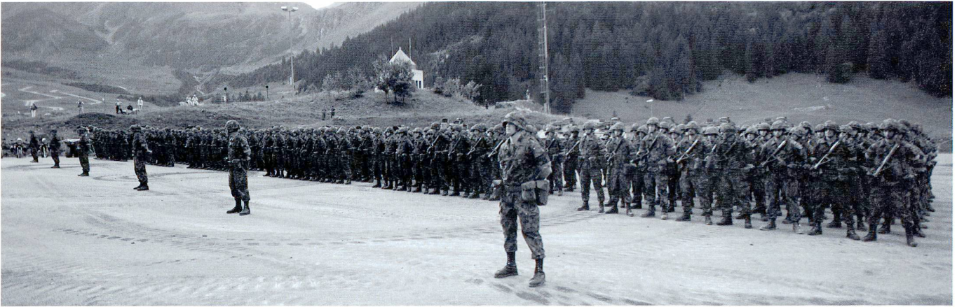
Ci-dessus et ci-dessous : remise de l'étendard, Wichlen, 25.08.2009.

d'exercice. Le 25 a été marqué par une inspection surprise d'une équipe de l'OSCE, par un tir de démonstration proposé à un public enthousiaste et averti – dont deux anciens commandants du bat chars 17. La journée s'est achevée par un défilé mécanisé (ZITADELLE) et la remise de l'étendard (ZOOK) orchestré par un adjudant de bataillon aguerri. Deux déplacements de chars (ZELZELE) ont permis à la 17/1 de rejoindre Wichlen et Hinwil, où a eu lieu la reddition et le licenciement, le 28 août.