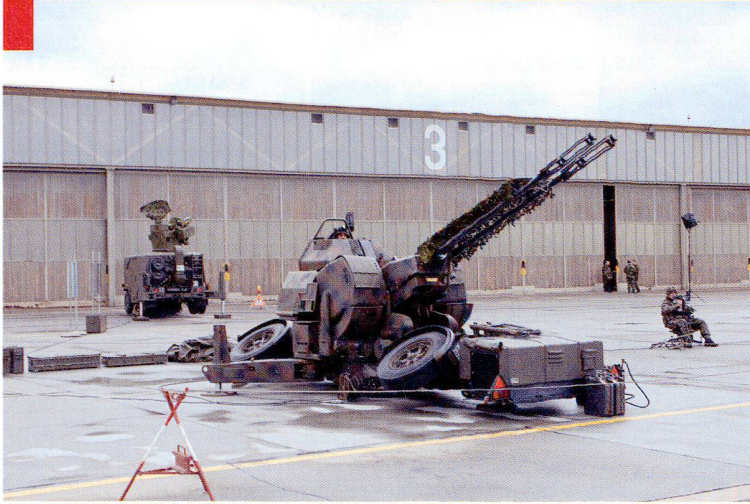
Ordre de bataille (OB)