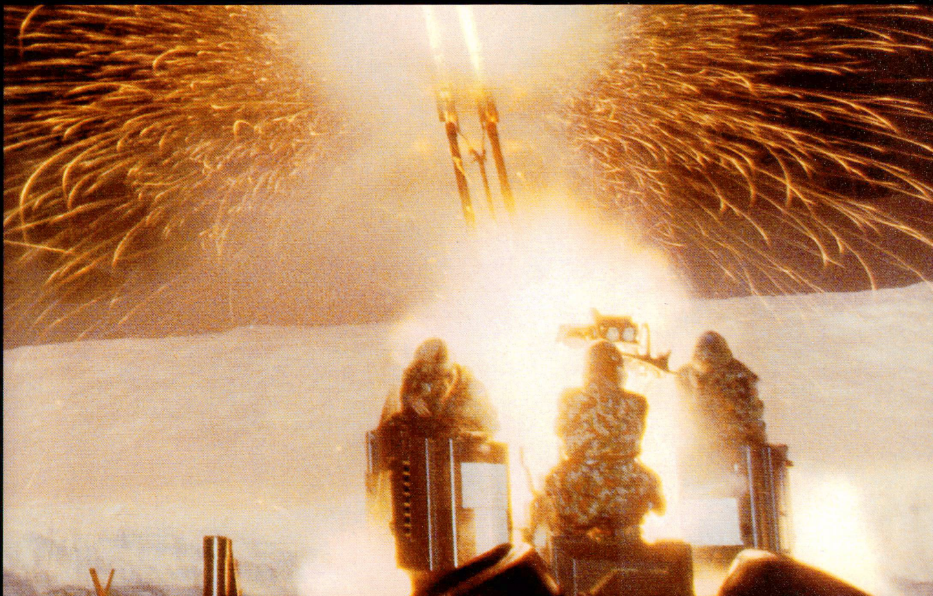
Le canon bitube 35 mm a une cadence de 1'100 coups par minute ; sa portée est de 4 km contre des buts aériens.