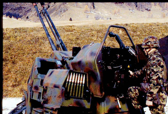
Le canon DCA 63/90, revalorisé, permet une automatisation poussée et donc une équipe de servants réduits. Ceux-ci sont également mieux protégés.