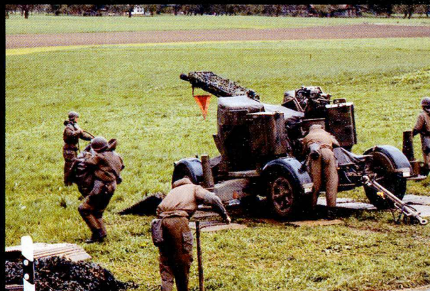
Le canon DCA 63 d'origine nécessitait une équipe de pièce importante pour la mise en batterie ainsi que pour le rechargement des pièces.