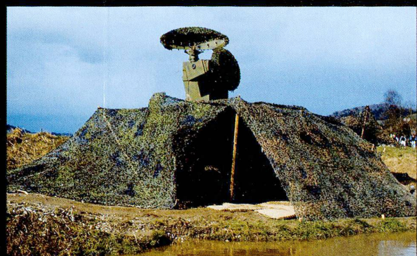
L'appareil de conduite de tir comprend un radar de surveillance, un radar de poursuite, ainsi qu'un viseur optique jour/nuit.