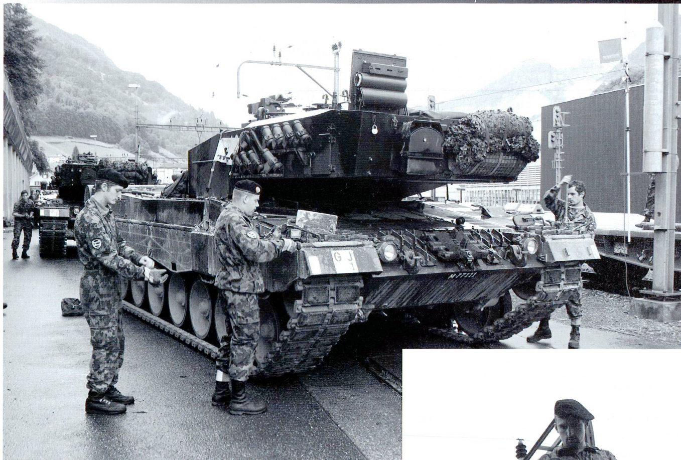
Ci-dessus : Chargement de la compagnie de chars 17/1 au complet à Schwanden GL le 26.08.09 durant l'exercice ZELZELE (tremblement de terre en persan).

A droite : Les travaux s'effectuent dans le strict respect des prescriptions de sécurité et sous contrôle. Les lignes de contact doivent au préalable être mises hors tension et surveillées.