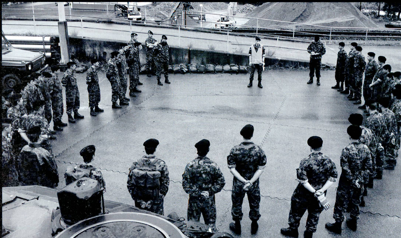
Les prescriptions de sécurité sont répétées avant le chargement sur le train.