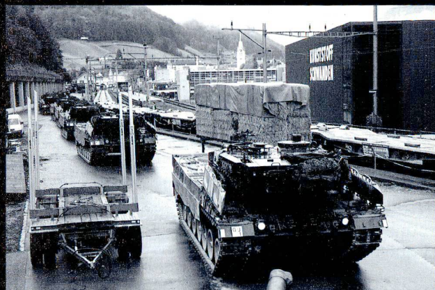
Les véhicules sont vérifiés avant le chargement.