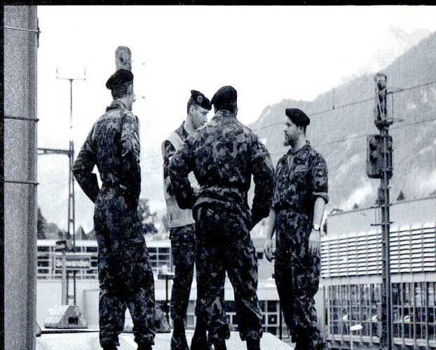
Le responsable du chargement (ici le chef chemins de fer de la br 1) oriente la troupe et prend les mesures de coordination.