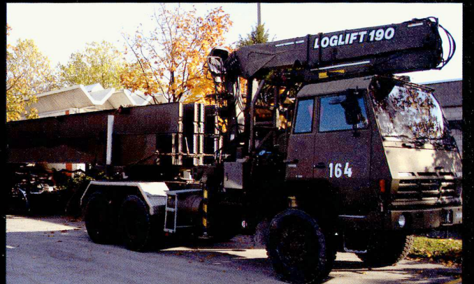
Certains éléments du Génie nécessitent des moyens de transport adaptés.