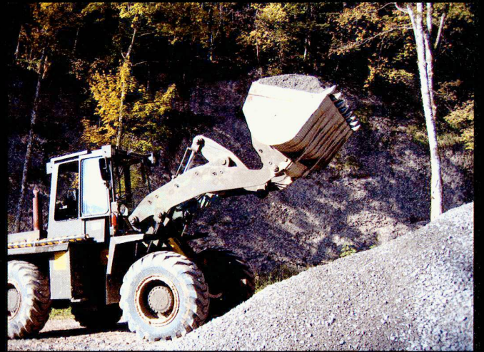
Les pelles mécaniques appuient l'engagement des sapeurs.