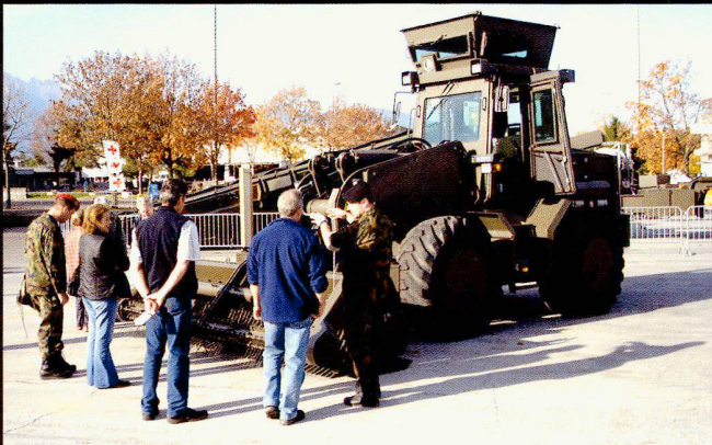
Les troupes du Génie disposent également de moyens de minages et de déminage.