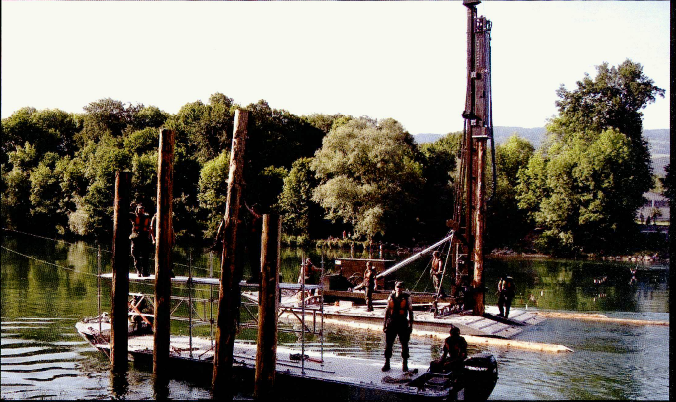
Construction d'un pont au moyen d'une sonnette.