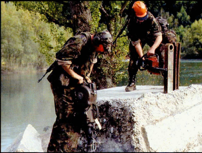
Les sapeurs peuvent être engagés sur des chantiers pour déblayer ou construire des obstacles en tous genres.