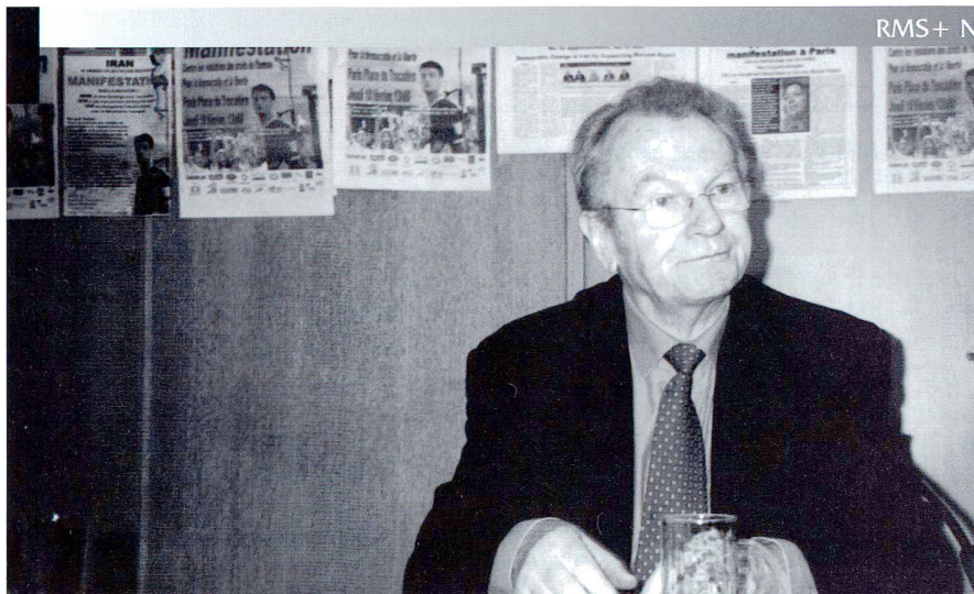
Yves Bonnet.