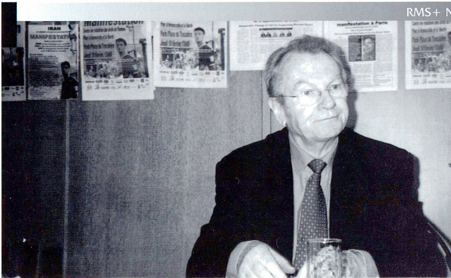
Yves Bonnet.