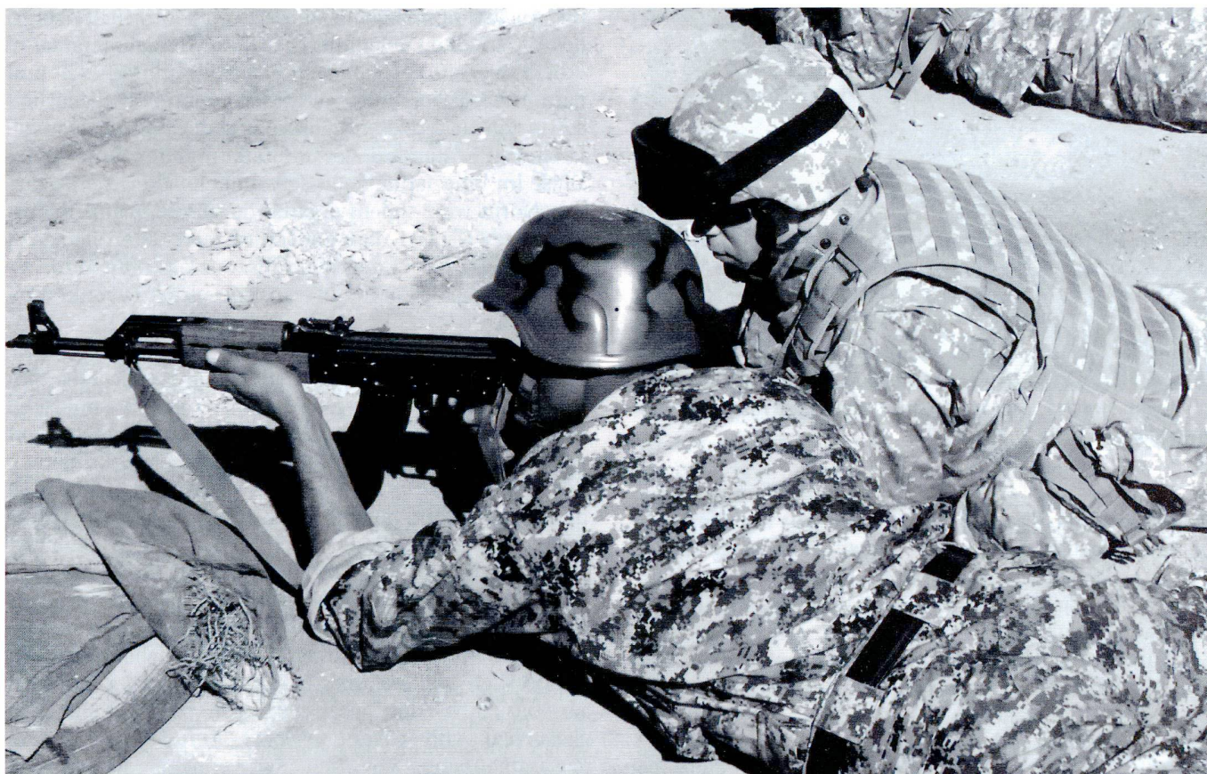
Instruction au tir et encadrement de soldats de l'armée nationale afghane (ANA) par des moniteurs américains.

und militärischen Operationen. Da die Sicherheits-Agenten selbst die professionelleren Experten in Sachen Sicherheit sind, ist ihr eigener Ratschlag vital für eine gelungene Sicherheitspolitik. Gleichzeitig benötigt eine Administration in demokratischen Staaten eine hinreichende Anzahl zusätzlicher, ziviler (Sicherheits-)Experten, die in Verteidigungsministerien und dem Parlament eine wichtige Scharnierfunktion innerhalb der ZMB wahrnehmen. Nicht zuletzt sollte stets eine breitere Öffentlichkeit von unabhängigen Journalisten und zivilgesellschaftliche Institutionen gefördert werden, die sich regelmässig und informiert mit Sicherheits- und Verteidigungspolitik auseinandersetzen. Denn in einer demokratischen Gesellschaft darf die Formierung einer ‚Sicherheits- und Verteidigungsgemeinschaft‘ nicht einem exklusiven Club von Agenten und informellen Kreisen vorbehalten sein. Sie muss notwendigerweise, wenn auch differenziert, eine breitere, über die Staatlichen Gewalten hinausreichende Experten-Gemeinschaft miteinbeziehen. Sektoren-übergreifenden öffentliche Debatten, die über die Parlamente hinausreichen, sind ein wichtiger Bestandteil gerade auch im Prozess der Formulierung von Sicherheitspolitik.