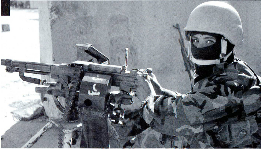
L'armée irakienne est formée et équipée par les forces de la Coalition, menée par les Américains.