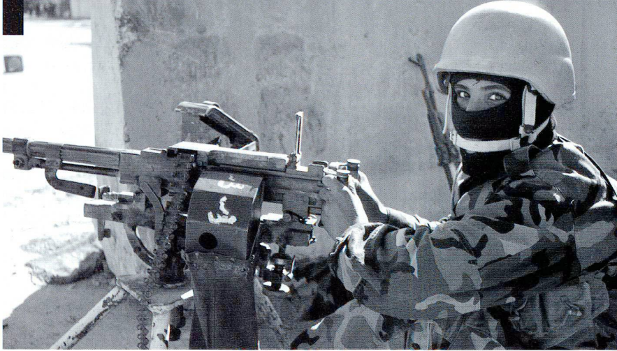
L'armée irakienne est formée et équipée par les forces de la Coalition, menée par les Américains. Photos © US Army.