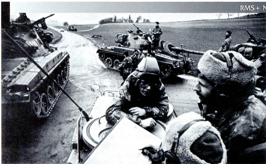
Manœuvres de la division mécanisée 1, sur le plateau vaudois et fribourgeois.