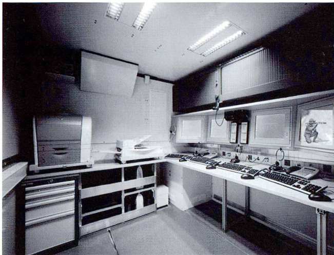
Ci-dessus : les organes de renseignement doivent disposer d'organes d'exploitation mobiles et permettant un engagement dans la durée, à l'instar du container SISSY.

La diffusion («The only thing harder than getting a new idea into the military mind is to get an old one out» Sir B.H. Liddell Hart)