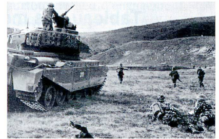
Tir de combat combiné de bataillon, sur la place d'armes de Bière VD.