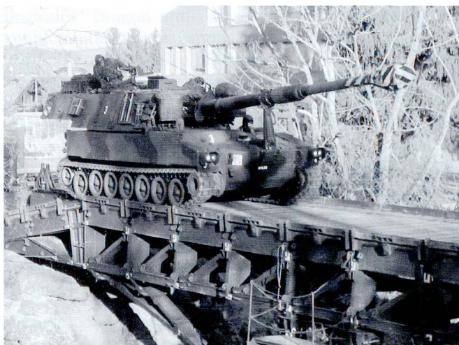
Au cours des exercices d'engagement, les aspirants vivent de manière réaliste l'engagement de leur arme et la collaboration interarmes.

de gallons »- durant la phase d'instruction en formation (VBA), qui est la dernière phase de l'Ecole de recrues. Les buts de l'Ecole d'officiers sont les suivants :