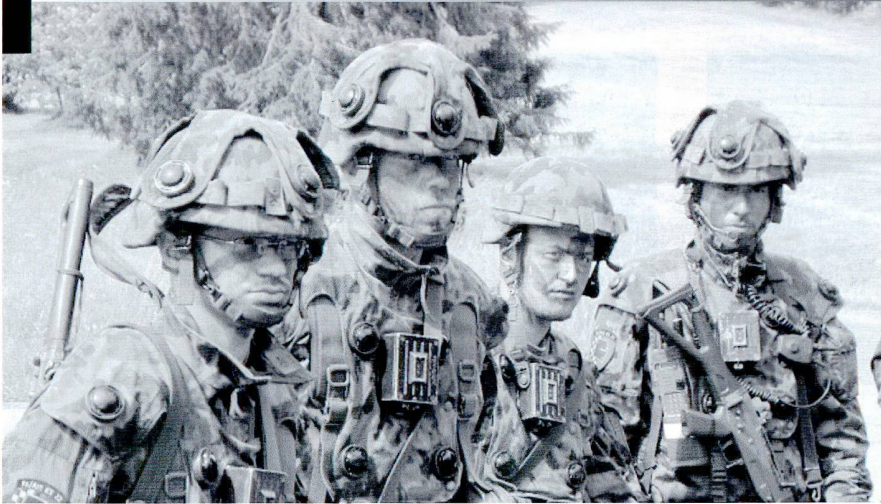
La formation d'officier mélange des bases théoriques et des exercices/expériences personnelles et de groupe.