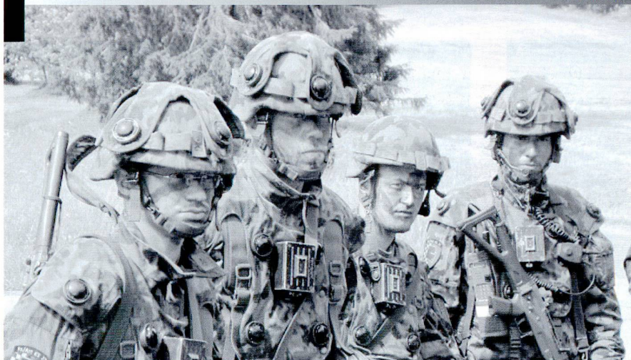
La formation d'officier mélange des bases théoriques et des exercices/expériences personnelles et de groupe.