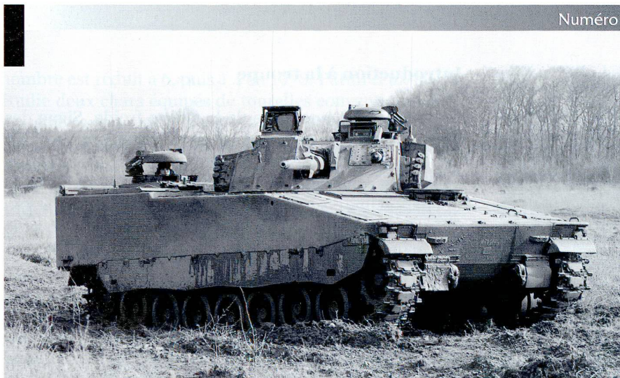
186 chars de grenadiers 2000 (CV-9030) sont en service en Suisse.