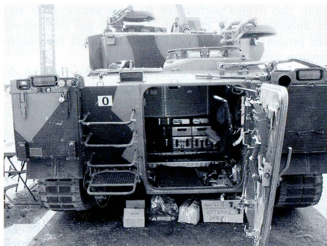
Les CV-90 suédois disposent d'une porte latérale motorisée. La version suisse dispose, quant à elle, d'une rampe verticale plus large.

Le successeur du Pb 302 est le « véhicule de combat » CV-90, développé par Hägglunds à partir de 1984. Depuis 1993, plus de 1170 véhicules de cette famille ont été produits. Ils sont en service en Suède (509, dont 42 surblindés), en Norvège (104 véhicules livrés à partir de mars 2005), en Suisse (186 livrés entre 2002 et 2005) et en Finlande (57 livrés à partir d'avril 2002, sur une commande totale de 150 engins). Les Pays-Bas ont commandé en décembre 2004 192 CV9035, qui doivent être livrés entre 2007 et 2010. Enfin, le Danemark a commandé en décembre 2005 45 véhicules, pour une livraison en 2007-2009 et prévoit d'en acquérir 45 supplémentaires en 2009. Le coût unitaire des véhicules varie d'un contrat à l'autre, en fonction des options et des accords de licence ou de compensations. Le contrat finlandais de 45 CV-9030 s'élevait à 120 millions €, pour un coût unitaire de 2,67