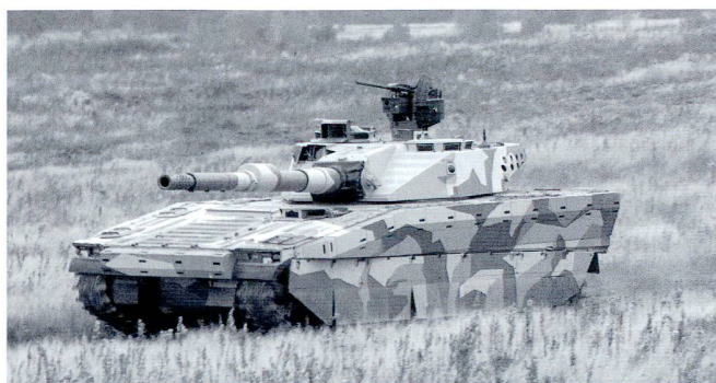
CV-90120T en camouflage « urbain » et doté de contre-mesures actives.