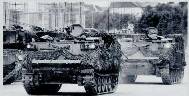
Le char du Génie 63 sert transport au transport des sapeurs.