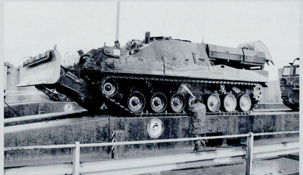
Le char du Génie est en mesure de déblayer tous types d'obstacles sous la protection d'un blindage.