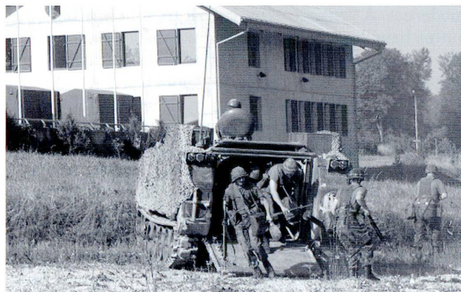
Un groupe de sapeurs débarque en bordure du village d'exercice de Nalé.

Alors que la compagnie état-major avait pour mission d'assurer les liaisons et la disponibilité des moyens de conduite bataillonnaires, la section d'exploration a reçu une tâche difficile : identifier 100% des moyens adverses sans perdre plus de la moitié de ses propres moyens.