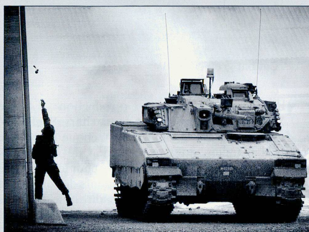
Entraînement au combat de localité sur la place d'armes de Bure.

Commandant du bataillon de grenadiers de chars 18