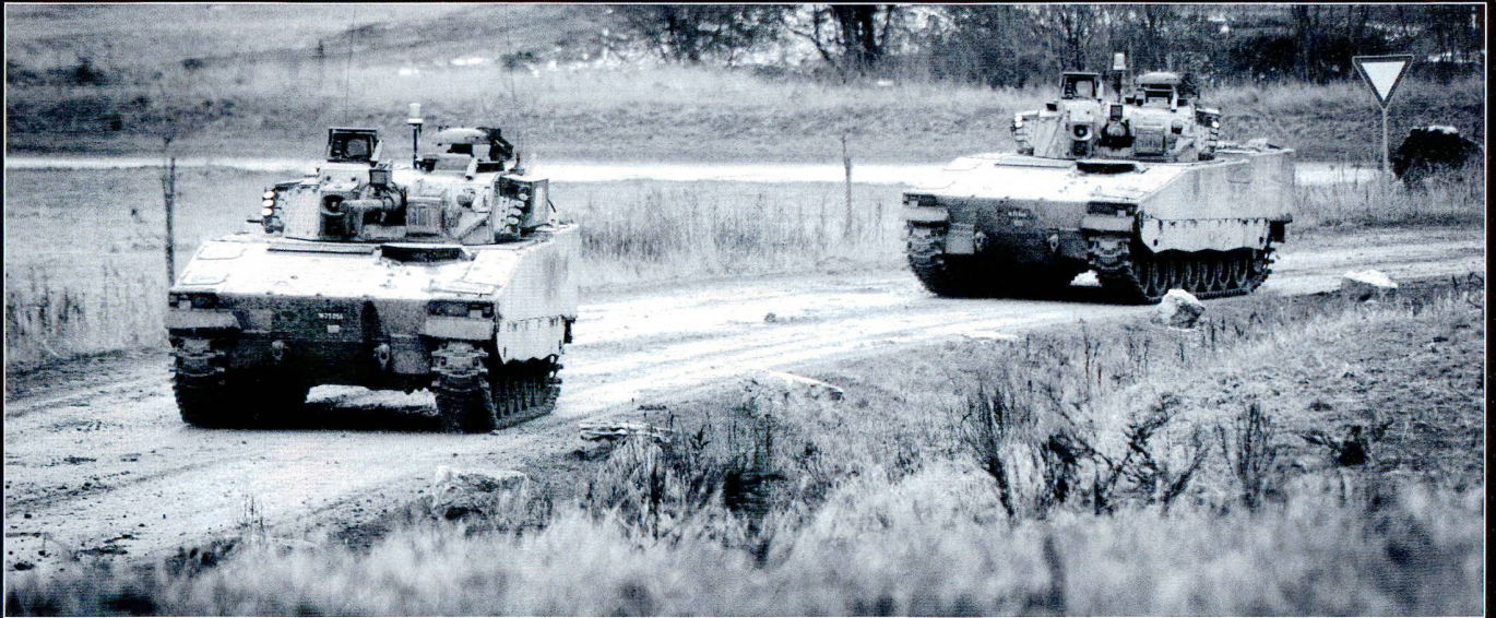
Le bat gren chars 18 à l'entraînement sur la place d'exercice de Bure.