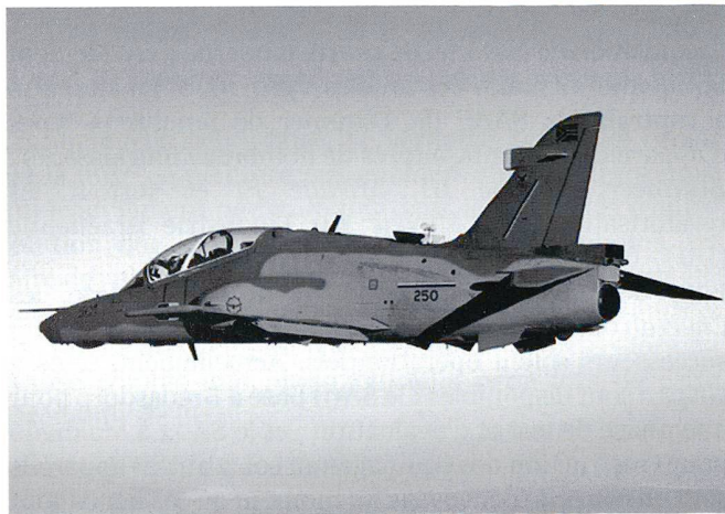
Le Hawk Mk.120 sert désormais de chasseur de première ligne au sein de la SAAF.

Le commandement des forces sud-africaines a donc décidé de recourir à une solution d'interim. 23 des 24 appareils d'entraînement Hawk Mk120 de fabrication britannique ont été revalorisés et servent désormais de chasseurs dans des scénarios de basse intensité. Dépourvus de radars et incapables de franchir le mur du son, ils ont cependant reçu une avionique adéquate et, capables d'emporter un canon de 30 mm et deux AIM-9 Sidewinder , sont en mesure d'assurer l'interception d'intrus subsoniques. Leur capacité d'emport de 3 tonnes leur permet en outre d'emporter un arsenal air-sol adéquat.