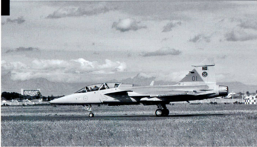
Le premier Gripen sud-africain SA01 est encore utilisé pour des essais et ne sera opérationnel que cet automne.