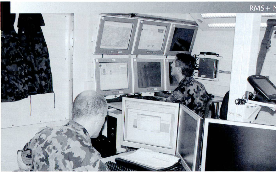
La brigade d'infanterie de montagne 10 a déjà participé à plusieurs exercices et simulations sur le système de conduite des Forces terrestres (FIS HE), dont le prototype est basé à Thoune.