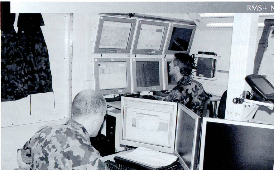
La brigade d'infanterie de montagne 10 a déjà participé à plusieurs exercices et simulations sur le système de conduite des Forces terrestres (FIS HE), dont le prototype est basé à Thoune.