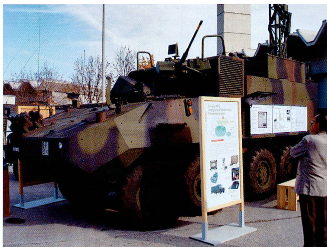
Char RAP (Radio Access Point)

Grâce au RITM et à un numéro unique d'abonné (PIN), le téléphone de campagne permet de s'annoncer et de communiquer par fil ou radio.