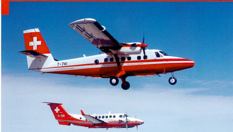
Les 2 avions du service de vol: Twin Otter DHC-6-300 (devant) Super King Air 350C (derrière)