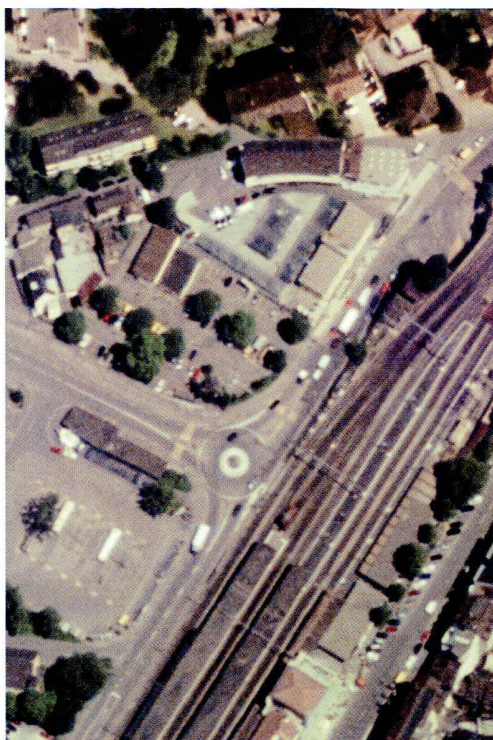
Swissimage Level 1 (ancienne génération à gauche) et Level 2 (nouvelle génération, à droite)